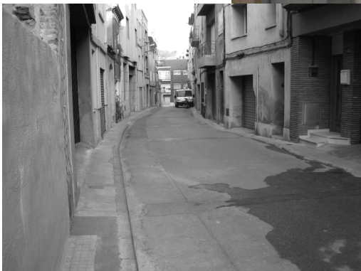
Carrer de Dalt