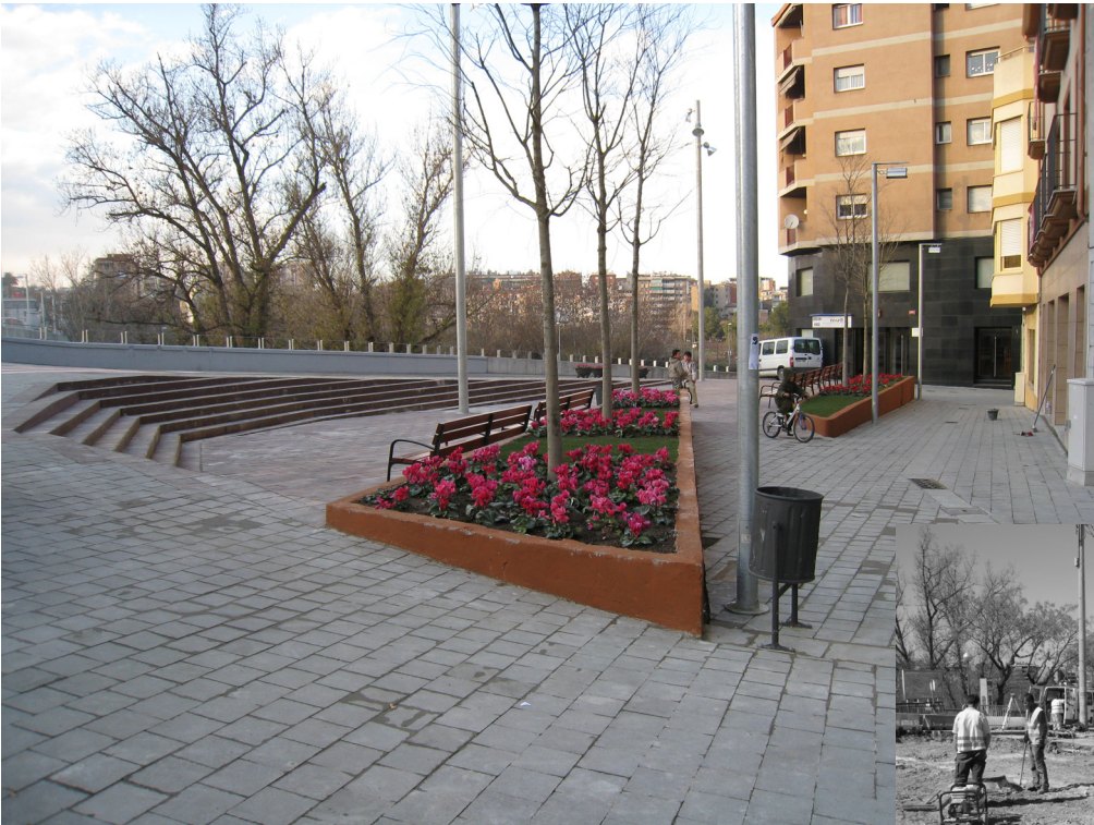
Plaça Portal d'Anoia.