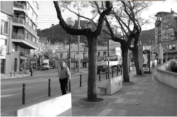
Plaça Portal d'Anoia.