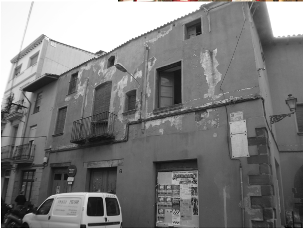
Casa Par (vista façana principal)