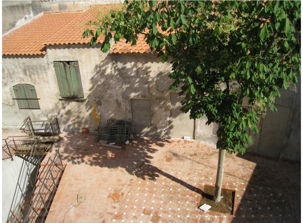
Casa Par (vista façana posterior i jardí)